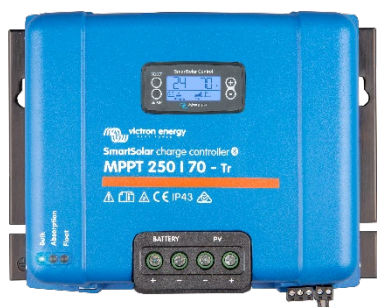
SmartSolar laadcontroller MPPT 250/70-Tr met optioneel koppelbaar display