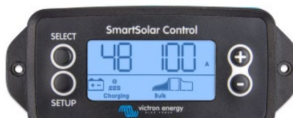
SmartSolar inplugbaar display