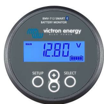
Bluetooth-detectie: BMV-712 Smart Battery Monitor