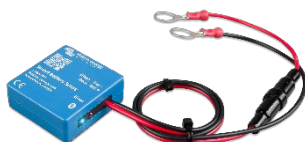
Bluetooth-detectie: Smart Battery Sense