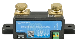
Bluetooth detectie: SmartShunt