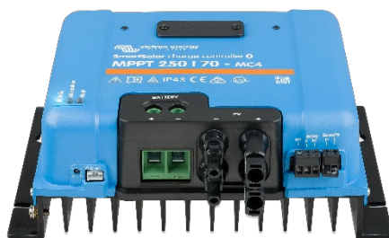
SmartSolar laadcontroller MPPT 250/70-MC4 zonder display